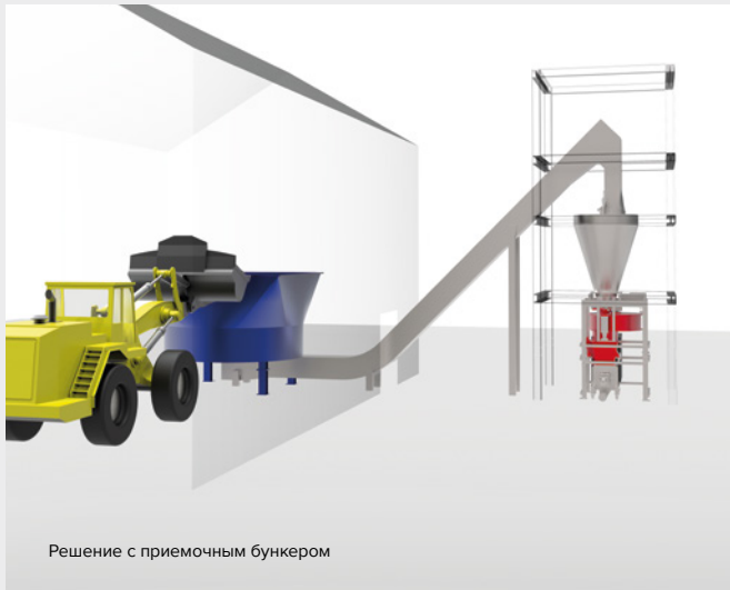
Решение с приемочным бункером

Первый вариант – приемочный бункер, который подходит для загрузки фронтальными погрузчиками или краном и является предпочтительной установкой в случае стационарного хранения топлива.